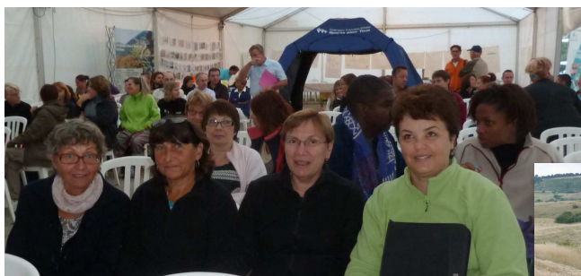
Matinée de travail pour les CD 39 et 25