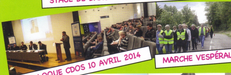
COLLOQUE CDOS 10 AVRIL 2014