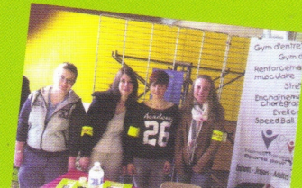
FESTIV'ELLES 08 MARS 2014