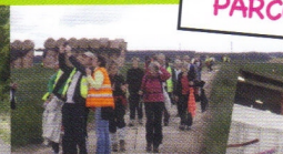
MARCHE VESPÉRALE 24 MAI 2014