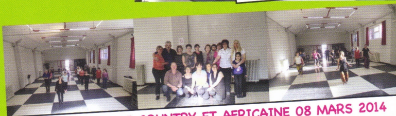
STAGE DE DANSE COUNTRY ET AFRICAINE 08 MARS 2014