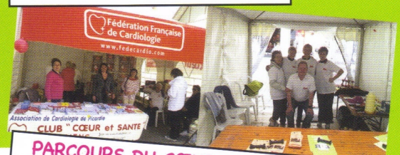
PARCOURS DU CŒUR 05 AVRIL 2014