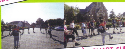
MARCHE NORDIQUE À DOMART SUR LA LUCE 21 JUIN 2014