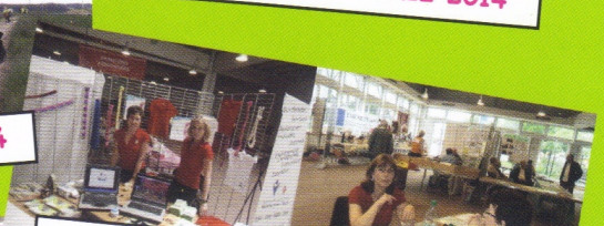
FOIRE EXPO DE PICARDIE JUIN 2014